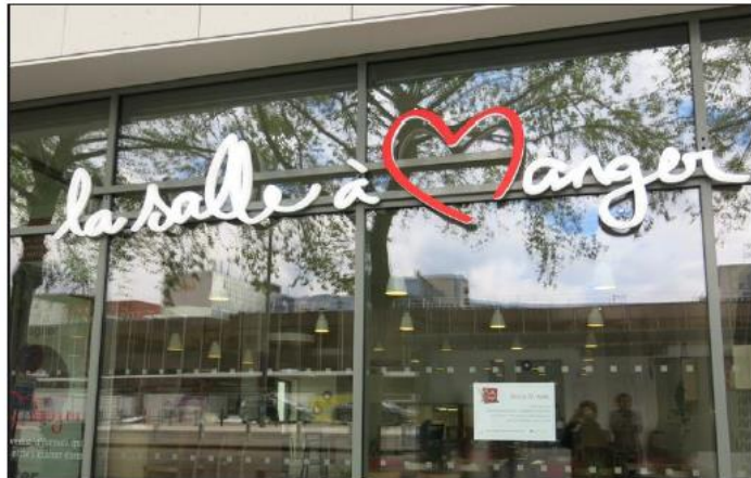
Situé face à la gare, le restaurant ouvrira ses portes le 21 avril.

Le restaurant sera ouvert le midi du lundi au vendredi et les mercredis et jeudis soir. Infos et réservations : tél. 04 38 02 96 16.